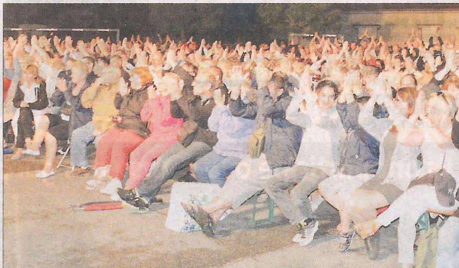
Comme toujours, un public dense et enthousiaste au gala du samedi soir.