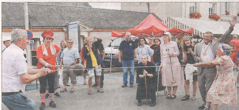
Une réjouissante séance de tir à la corde orchestrée par les comédiens de LAC.