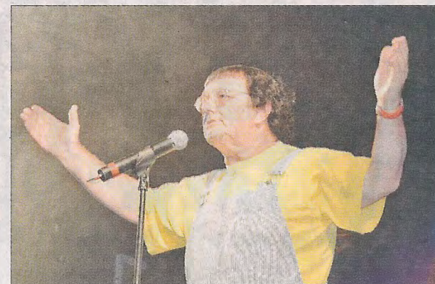
Le physique, la salopette et l'esprit de Coluche.