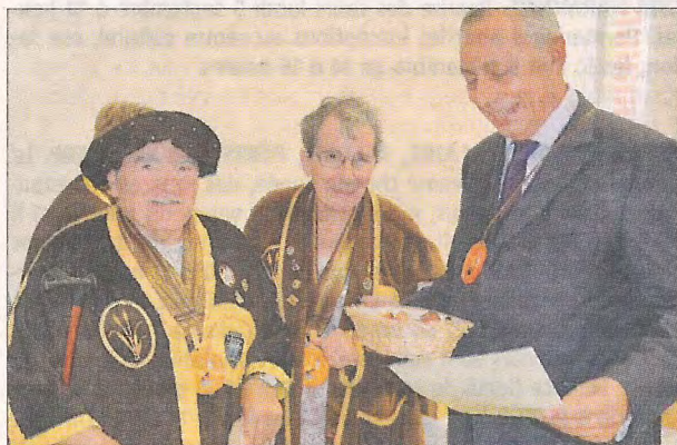
Le sous-préfet intronisé « maître chouquettier ».