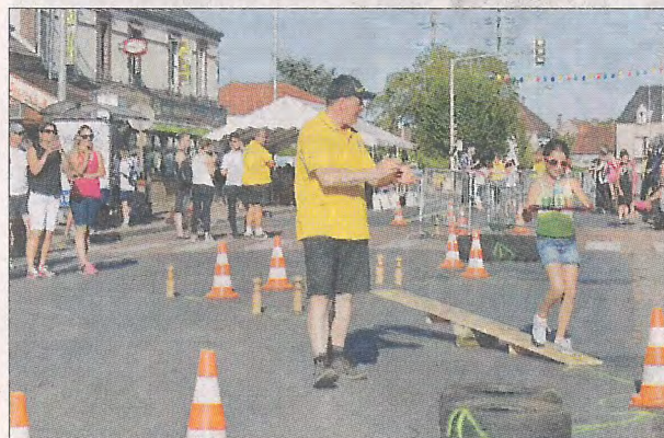
Lundi soir, la course des garçons de café.