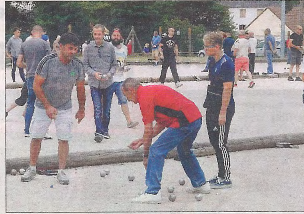
La fête commence toujours avec le concours de pétanque.