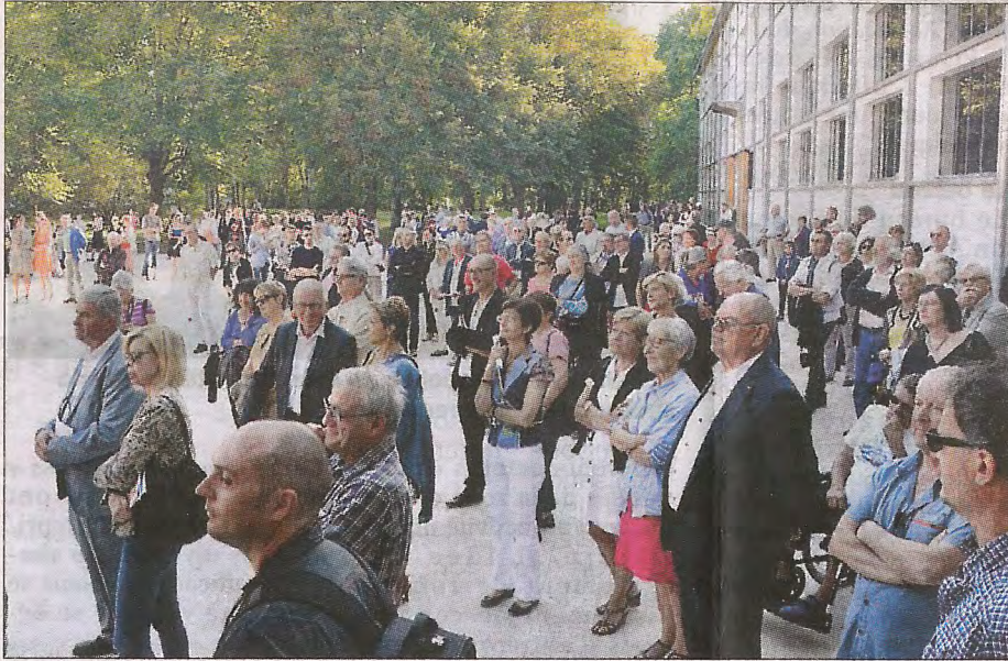
Des centaines de visiteurs ont été accueillis lors de cet événement à portée régionale.