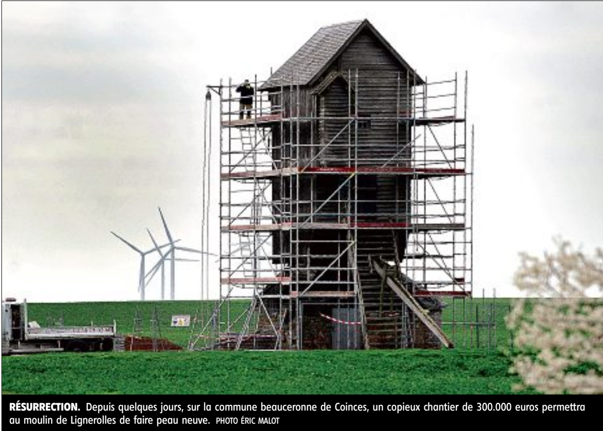
RÉSURRECTION. Depuis quelques jours, sur la commune beauceronne de Coinces, un copieux chantier de 300.000 euros permettra au moulin de Lignerolles de faire peau neuve.