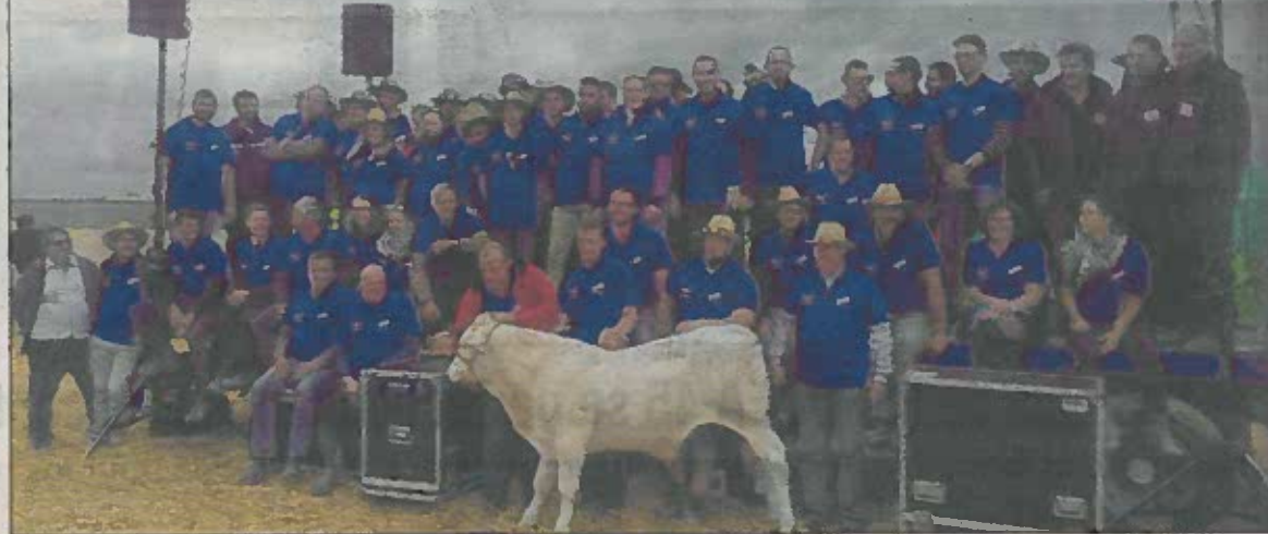
Le comité d'organisation a pu compter sur de l'aide de nombreux bénévoles dont celle d'anciens membres du syndicat.