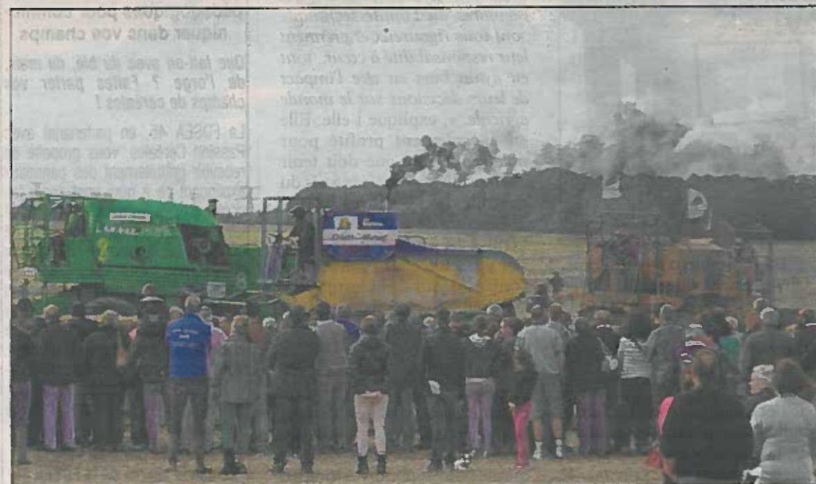
La course de Moiss'batt-cross a attiré la foule.