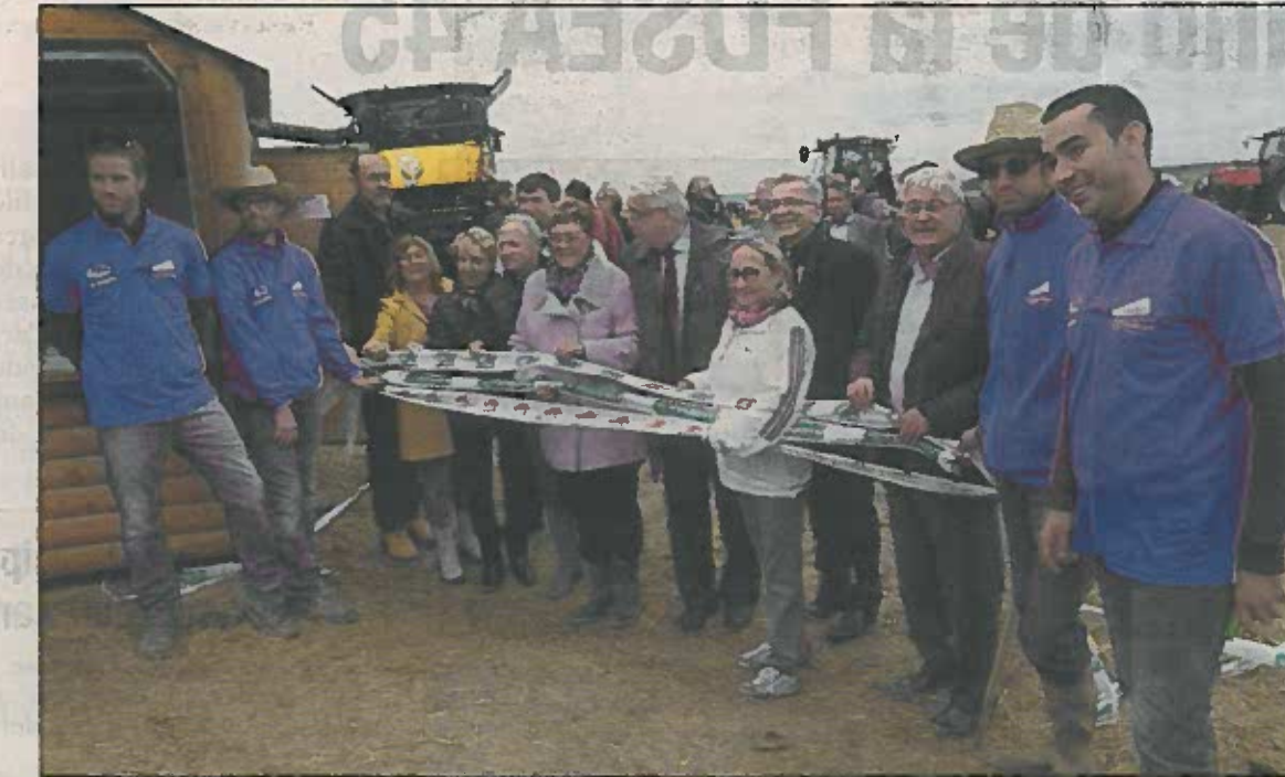
Inauguration officielle symbolisée par le coupé de «rubalise JA».

Le lendemain, la foule des grands jours a envahi le site d'une dizaine d'hectares. Dans l'allée principale se tenaient de part et d'autre un marché de producteurs locaux et une exposition d'animaux de la ferme