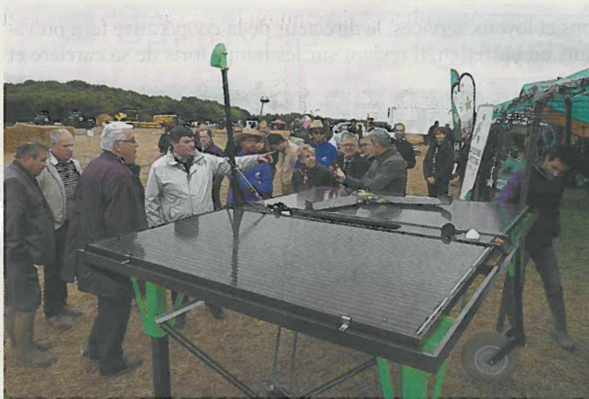
Les nouvelles technologies exposées à Terre en Fête.