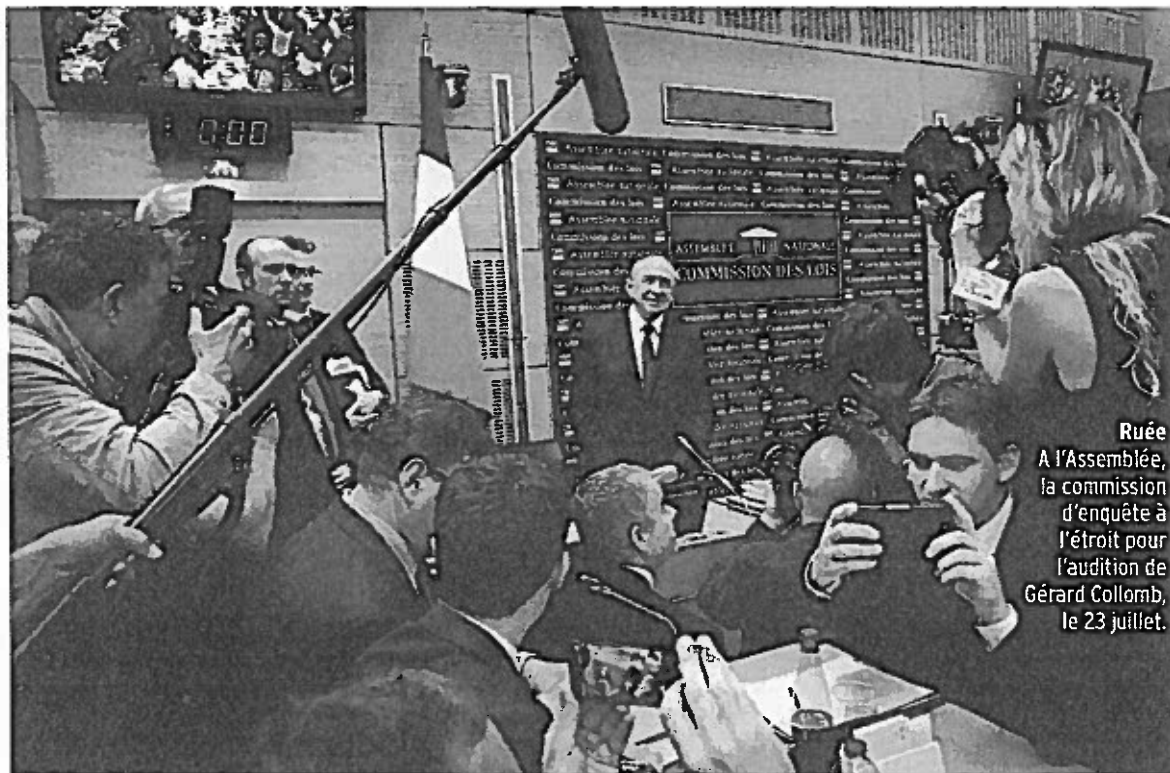
Ruée A l'Assemblée, la commission d'enquête à l'étroit pour l'audition de Gérard Collomb, le 23 juillet.