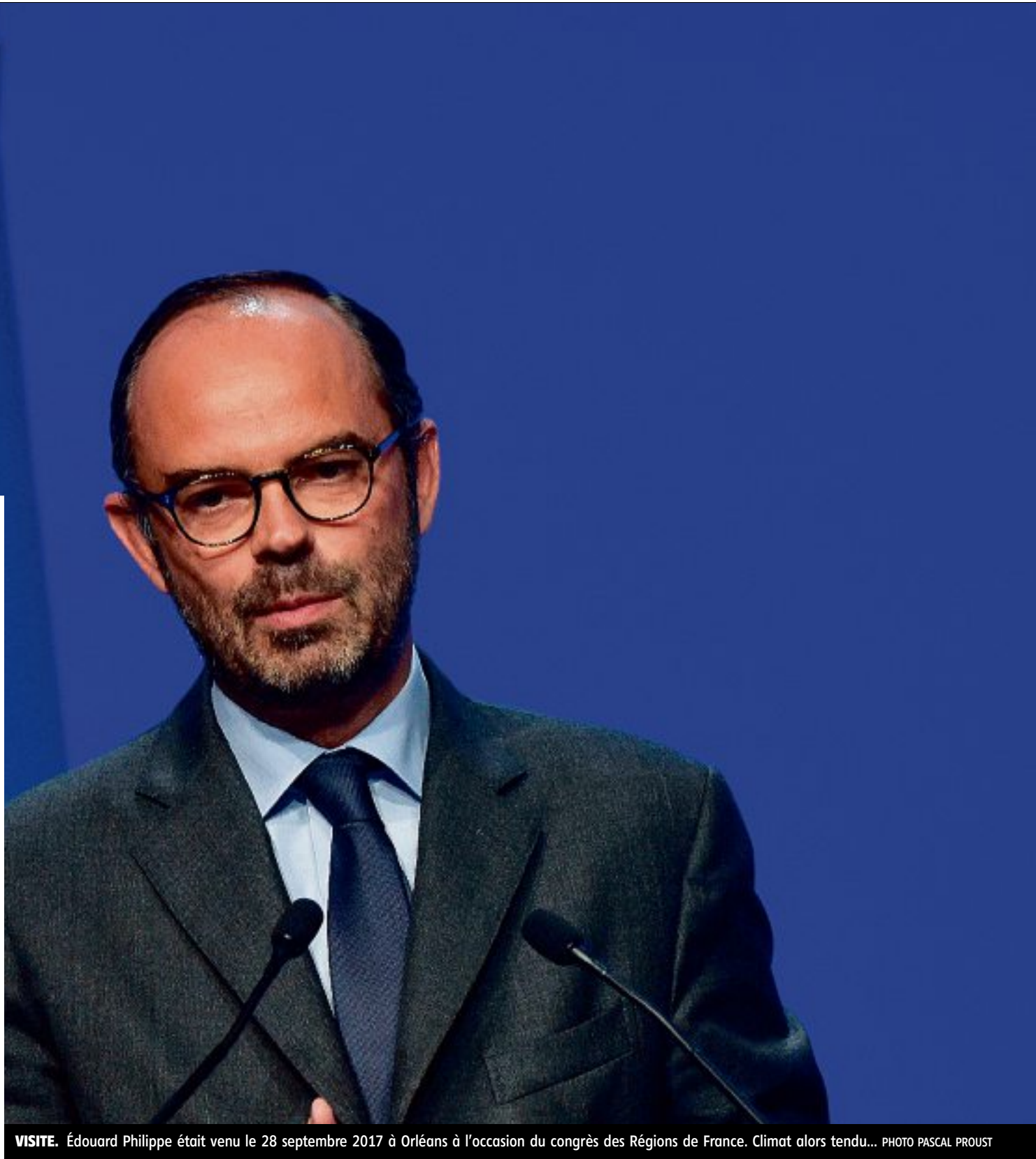
VISITE. Édouard Philippe était venu le 28 septembre 2017 à Orléans à l'occasion du congrès des Régions de France. Climat alors tendu...