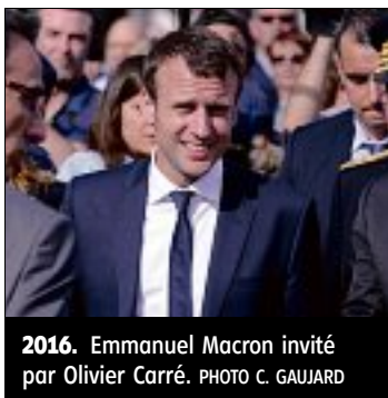
2016. Emmanuel Macron invité par Olivier Carré.