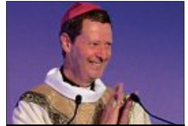
BIO. Il a 58 ans.