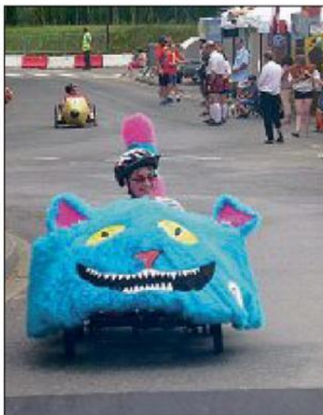
Au moment de franchir la ligne d'arrivée.

chaleur a occasionné une malaise à un pilote de la voiture Le Tigre qui a dû être transporté à l'hôpital de Gien. Une manifestation organisée par Atol28, qui avec la municipalité prend déjà rendez-vous pour 2019.