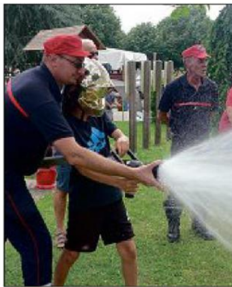
Peut-être un futur pompier qui découvre le métier.