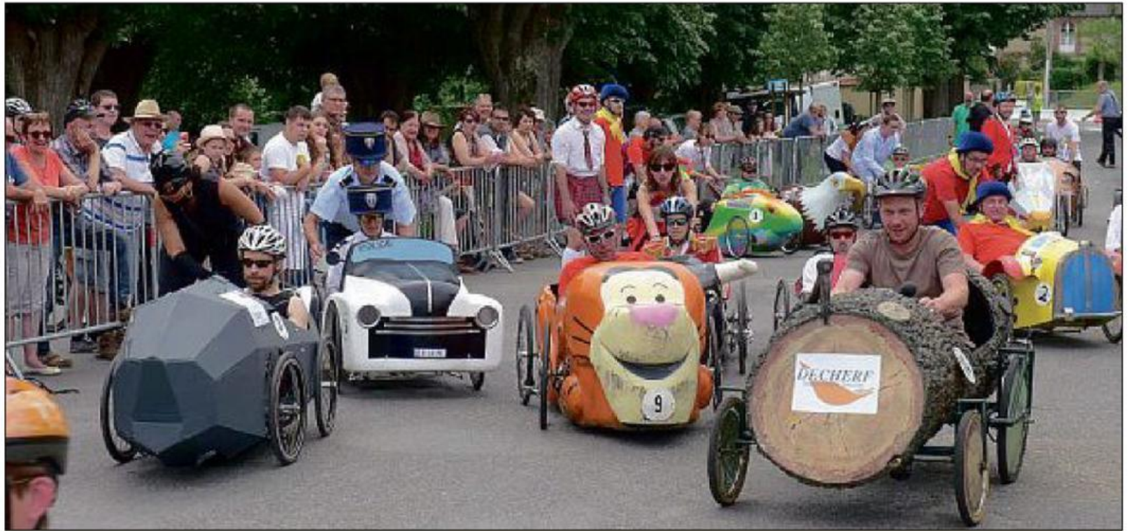
18 voitures à pédales étaient sur la ligne de départ samedi.

L'association Activités canines Sologne, basée à Autry, a seulement un an d'existence et se consacre à conseiller et guider ses adhérents dans l'éducation de leurs chiens afin de mieux se préparer à la participation de concours. Le club espère pour la prochaine fête du pain organiser une compétition