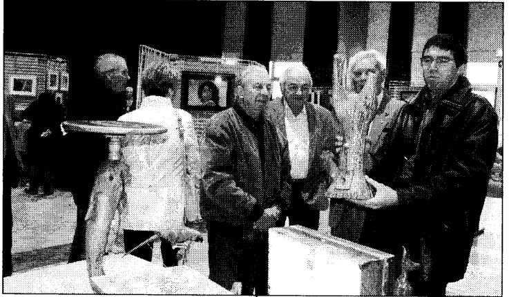
Les Créatives... une occasion de se rencontrer entre artistes