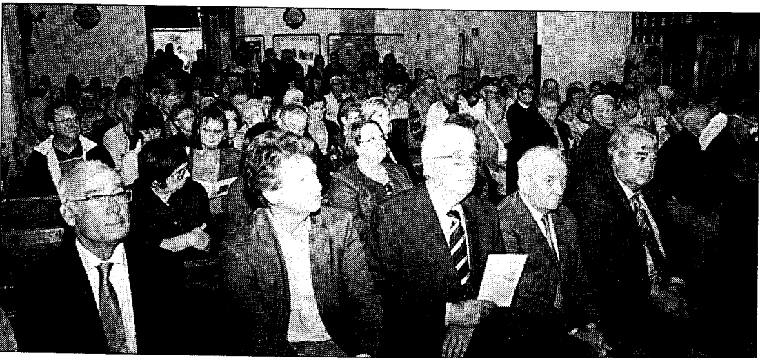
Les personnalités au premier plan d'une assistance venue très nombreuse.