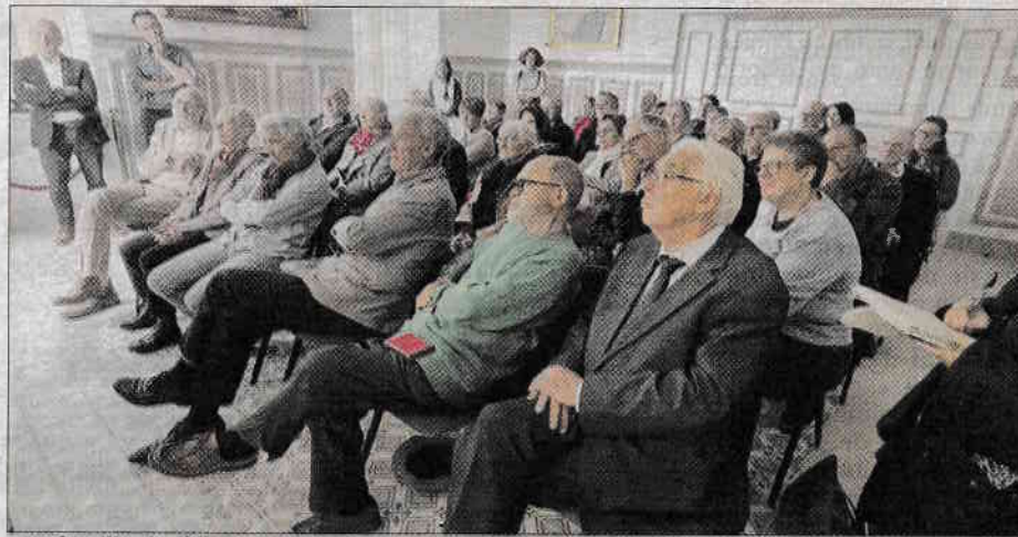
La famille de l'illustre médecin et maire de Gien, était présente lors de cette inauguration samedi.