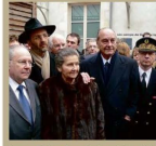
En 2011, Chirac inaugure le Cercil